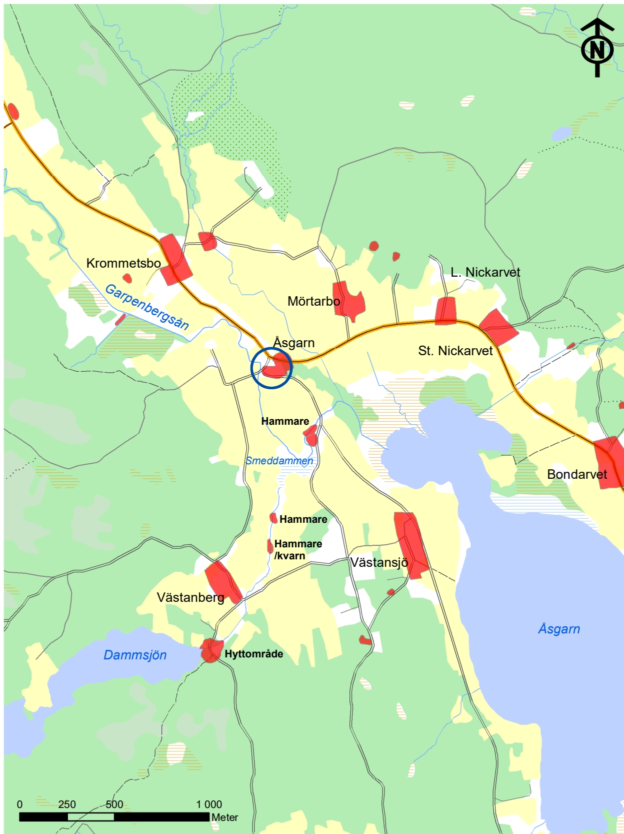
Bilaga 1. Utsnitt från terrängkartan med undersökningsområdet inom den blå cirkeln. Forn- och kulturlämningar markerade med röda polygoner och hyttor och hammare med förklarande text. Skala 1:20 000.